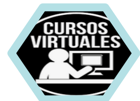
CAPACITACION GRUPAL VIRTUAL

Por su propia naturaleza, se trata de cursos abiertos, que se ajusta en cada caso a las necesidades del o los interesados. Puede desarrollarse en formato presencial, virtual o combinado.