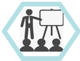
CURSOS PERSONALIZADOS PRESENCIALES O VIRTUALES